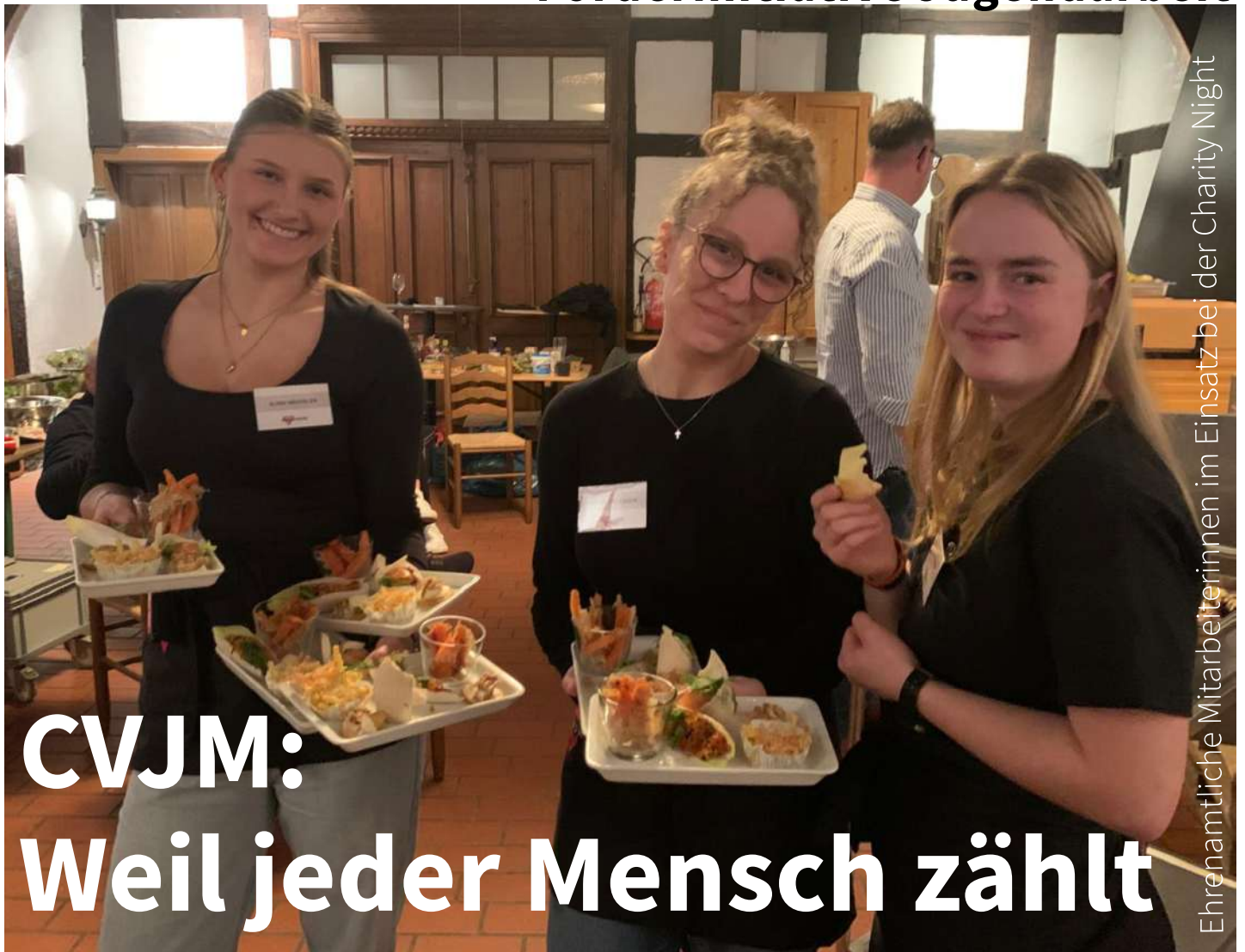
Ehrenamtliche Mitarbeiterinnen im Einsatz bei der Charity Night